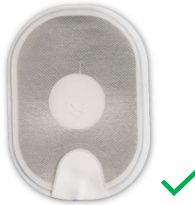
Figure 4 : électrode normale.