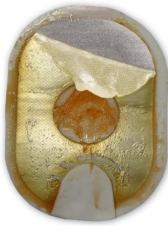
Figure 2 : le gel décollé et replié peut également sembler décoloré et/ou fondu.

Action : Appliquez les électrodes sur le patient. N'hésitez pas.