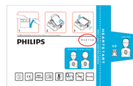
M5072A Sachet en aluminium