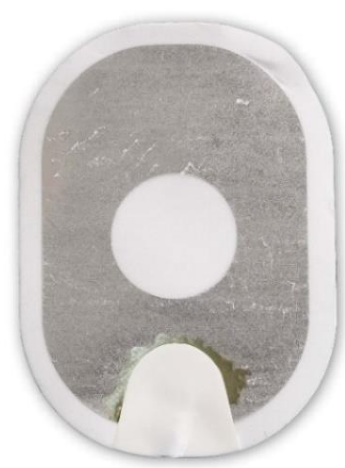
Figure 3 : gel presque complètement décollé du support.

Action : Appliquez les électrodes sur le patient. N'hésitez pas.