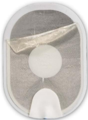
Figure 1 : gel décollé qui s'est replié sur lui-même lors du retrait de la feuille de protection.

Il est également possible que le gel se décolle presque complètement du support en mousse/étain lors du retrait de la feuille de protection (voir Figure 3.) Si la surface de contact du gel avec la peau est petite, un arc électrique peut se produire lorsqu'un choc est délivré, ce qui peut provoquer des brûlures sur la peau du patient. Il est aussi possible que le DAE ne puisse pas délivrer de choc à travers les électrodes. Un retard de traitement se produit lorsque l'utilisateur installe une cartouche d'électrodes de rechange (si disponible) ou effectue une RCP (réanimation cardiopulmonaire) ou un massage cardiaque en attendant l'arrivée du personnel des services médicaux d'urgence. À titre de comparaison, la Figure 4 montre une électrode normale. Quel que soit l'état de l'électrode, suivez les consignes vocales, car le DAE vous guidera tout au long des étapes nécessaires.